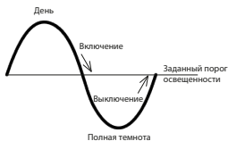
Режим « Ночь ».

Включить при повышении освещенности выше порога, выключить при снижении освещенности ниже порога. Например, для открытия штор с рассветом.