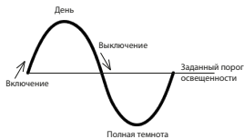
Режим « День ».

Режим «Ночь» - включение управляемого блока при снижении освещенности ниже порога срабатывания и выключение при повышении освещенности выше порога срабатывания.